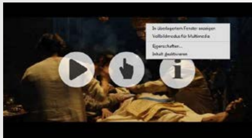
Kontextmenü interaktiver Elemente.

Da die Auflösung und das Seitenverhältnis der interaktiven PDFs für Whiteboards und Bildschirme (1024 x 768) optimiert ist, sollten Sie im Drucken-Dialogfenster unter dem Eintrag „Größe“ die Option „Anpassen“ verwenden, damit die Seiten im Querformat vollständig ausgedruckt werden können.