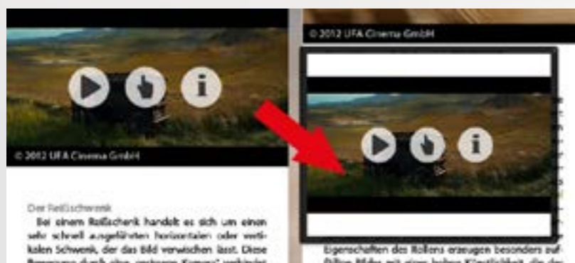
Herauslösen interaktiver Elemente.