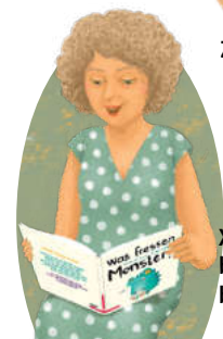
Xwêndina bi dengekî bilind