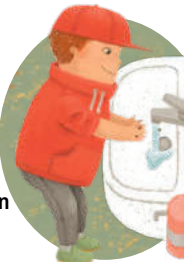
Destên xwe bişon