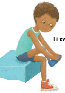
Li xwe kirin