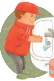
خپل لاسونه مینځل