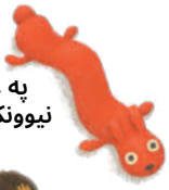
په غیر کې نیوونکي لوبڼکه