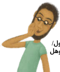
غږ کول/ زنگ وهل