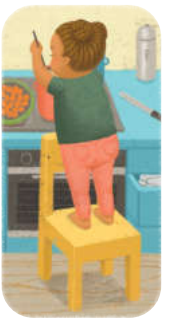
پخت و پز