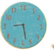
ساعت رنگ آبی