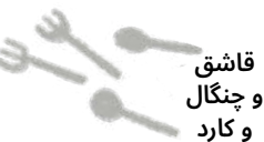
قاشق و چنگال و کارتد