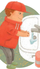
دستانتان را بشوید