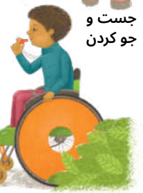
جست و جو کردن