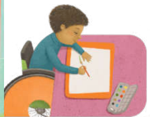
برای نقاشی کردن

به من بگوئید: بازی مورد علاقه شما چیست؟ چه آوازی می توانید بخوانید؟