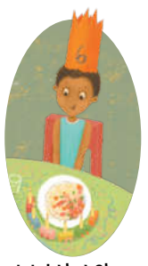
እቲ ዕለት ልደት