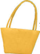
እታ ብጫ ቦርሳ