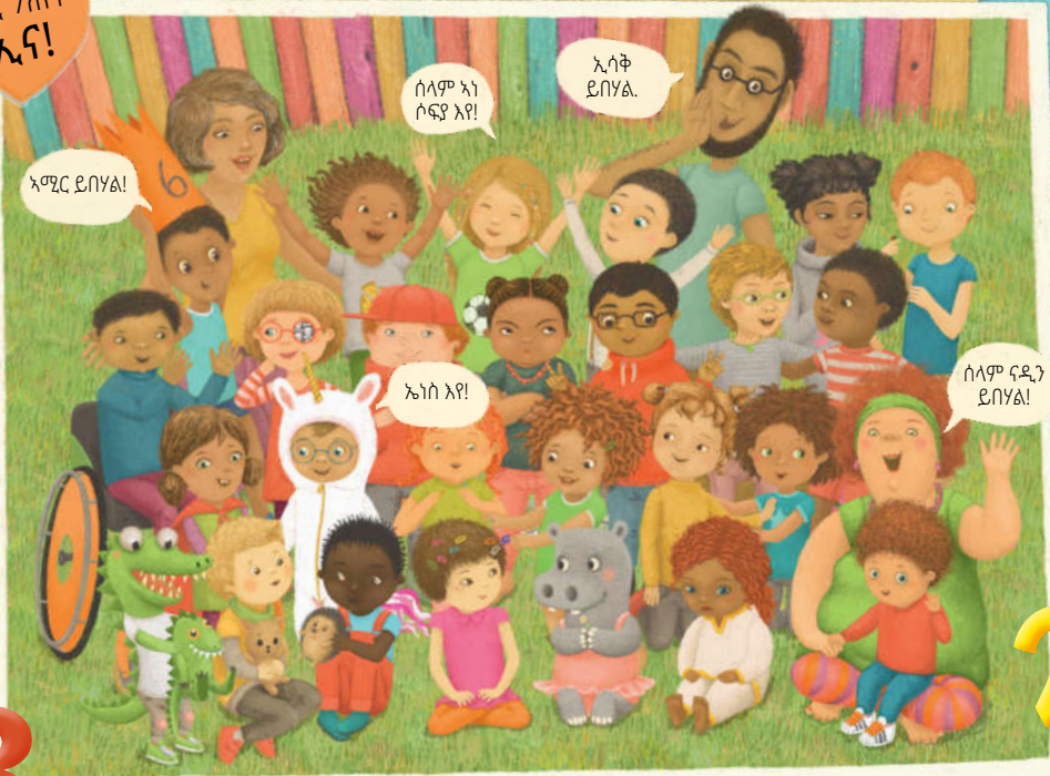
እዚ ጉጅለ ፔንጊዩን ምስ ኩሎም ቆልዑን መምህራንናን እዩ።