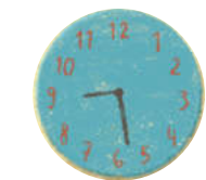
ኣት ሰምያዊት ሰዓት