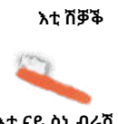
እቲ ናይ ሰነ ብረሽ