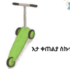
እታ ቀጠልያ ስኩተር