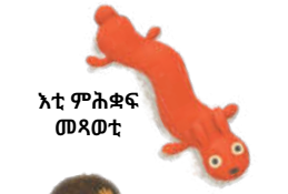
እቲ ምሕቋፍ መጻወቲ