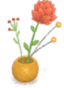
እቲ ናይ ዕንባባ መቐመጢ