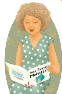
Хто читає вголос