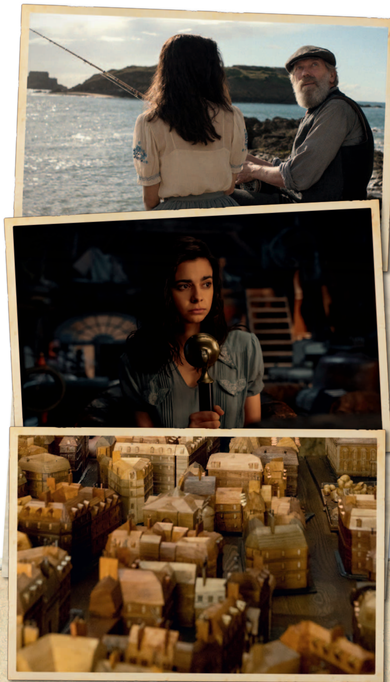
Oben: Marie-Laure (Aria Mia Loberti) und Onkel Etienne (Hugh Laurie) beobachten als Mitglieder der Résistance die Küste. Mitte: Marie-Laure sendet auf Frequenz 13.10. Unten: Daniels Holzmodell für seine blinde Tochter.