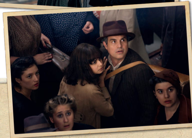
Oben: Die junge Marie-Laure (Nell Sutton) mit ihrem Vater (Mark Ruffalo) im Museum. Unten: Die ältere Marie-Laure (Aria Mia Loberti) und ihr Vater versuchen, das besetzte Paris per Zug zu verlassen.