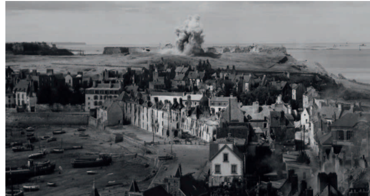
Bombenexplosion während der Schlacht um Saint-Malo 1944.

Zwei Tage später riefen die Amerikaner die Zivilbevölkerung zum Verlassen Saint-Malos auf. Über französische Mittelsmänner versuchten die Angreifer, den Stadtkommandanten Oberst von Aulock zur Kapitulation zu bewegen, was dieser jedoch ablehnte. Beim Vorrücken der amerikanischen Truppen durch Panzersperren und Minenfelder entwickelten sich heftige Gefechte mit hohen Verlusten. Erst nach zweiwöchigen Kämpfen und unter dem Einsatz von schwerer Artillerie und Bombern ergaben sich die verbliebenen 400 deutschen Besatzer. Die Altstadt war zu 80 Prozent zerstört.